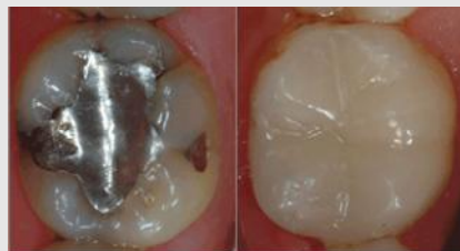
Bedenkliches Amalgam (links) oder verträgliche und ästhetische Füllungen aus Komposit oder Keramik (rechts)?

Als Kassenpatient haben Sie die Wahl zwischen Amalgam und kurzlebigen Kunststoff-Füllungen. Wenn Sie eine dauerhaftere und schönere Lösung wollen, sollten Sie sich für Kompositfüllungen oder für Keramikinlays entscheiden.