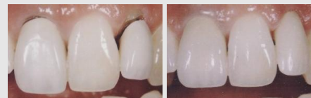
Metallkeramik-Kronen mit dunklen Rändern (links) und ästhetische Kronen aus reiner Keramik (rechts).

Wenn Sie wirklich schöne Zähne wollen, sollten Sie sich für Kronen und Brücken aus reiner Keramik entscheiden.